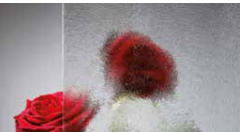
Ornamentglas Chinchilla weiß

Hochwertige flügelüberdeckende Kunststoff-Haustüren