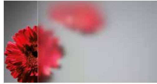
Ornamentglas Satinato weiß