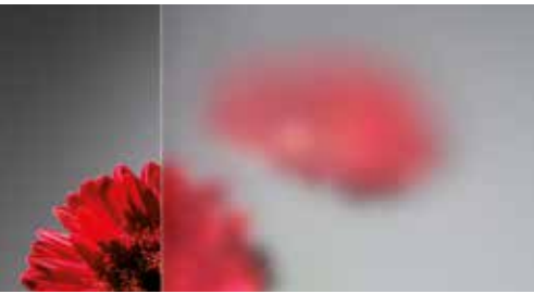
Ornamentglas Satinato weiß

Hochwertige flügelüberdeckende Kunststoff-Haustüren