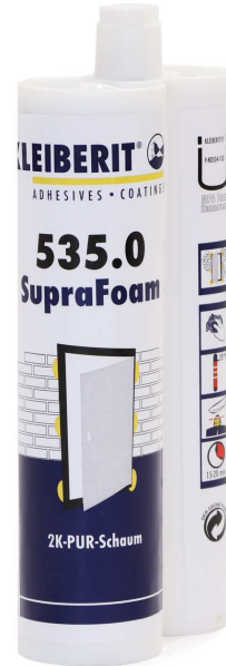
KLEIBERIT 535.0 SupraFoam in der Doppelkartusche