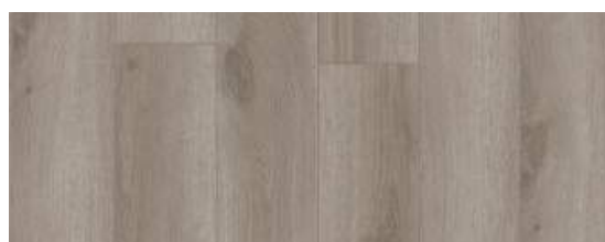
Contemporary Oak Grey