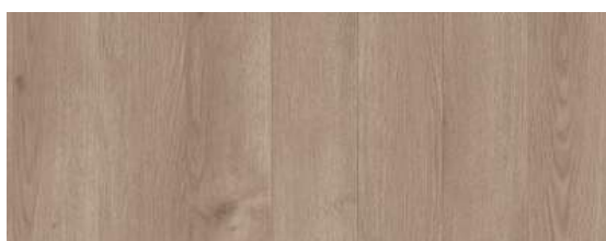
Contemporary Oak Grege