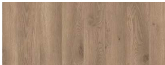
Contemporary Oak Natural