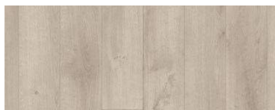
Rustic Oak Light Grey