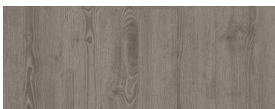
Scandinavian Oak Dark Grey