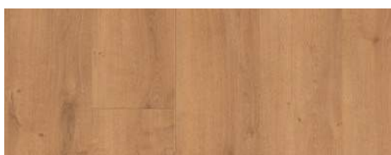
Rustic Oak Warm Natural