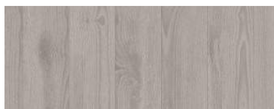
Scandinavian Oak Medium Grey