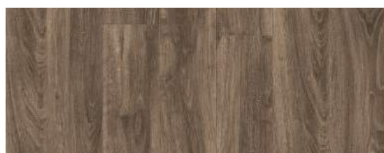
English Oak Brown