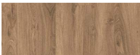
English Oak Natural