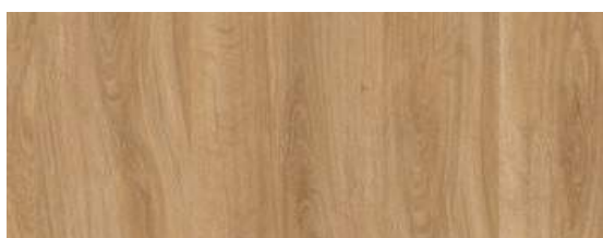
English Oak Classical