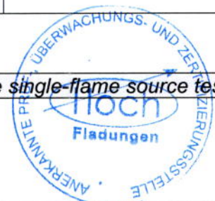
Tabelle / table 2: Prüfergebnis der Kleinbrennerprüfung / test result of the single-flame source test

Fs Flammenausbreitung [mm] Flame spread [mm]