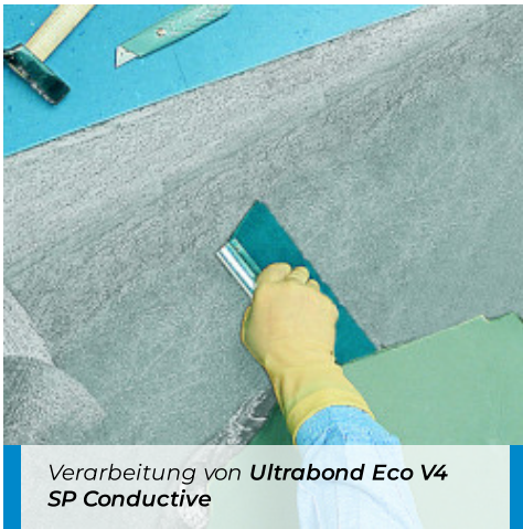
Verarbeitung von Ultrabond Eco V4 SP Conductive