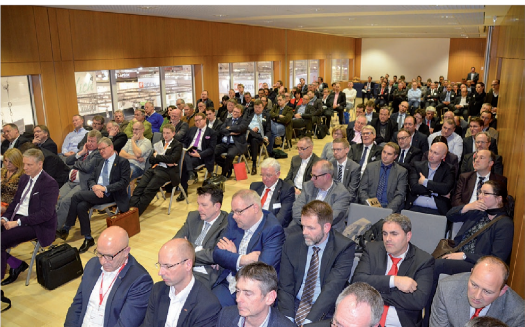
Über 160 Zuhörer verfolgten die Podiumsdiskussion „Handelsmarke vs. Herstellermarke“. Bereits zum fünften Mal veranstalteten das Holz-Zentralblatt, B+H Bauen und Holz sowie die Holzhandelskooperation Holzland im Rahmen der „Bau“ eine Diskussionsrunde, die aktuelle Themen der Branche aufgreift