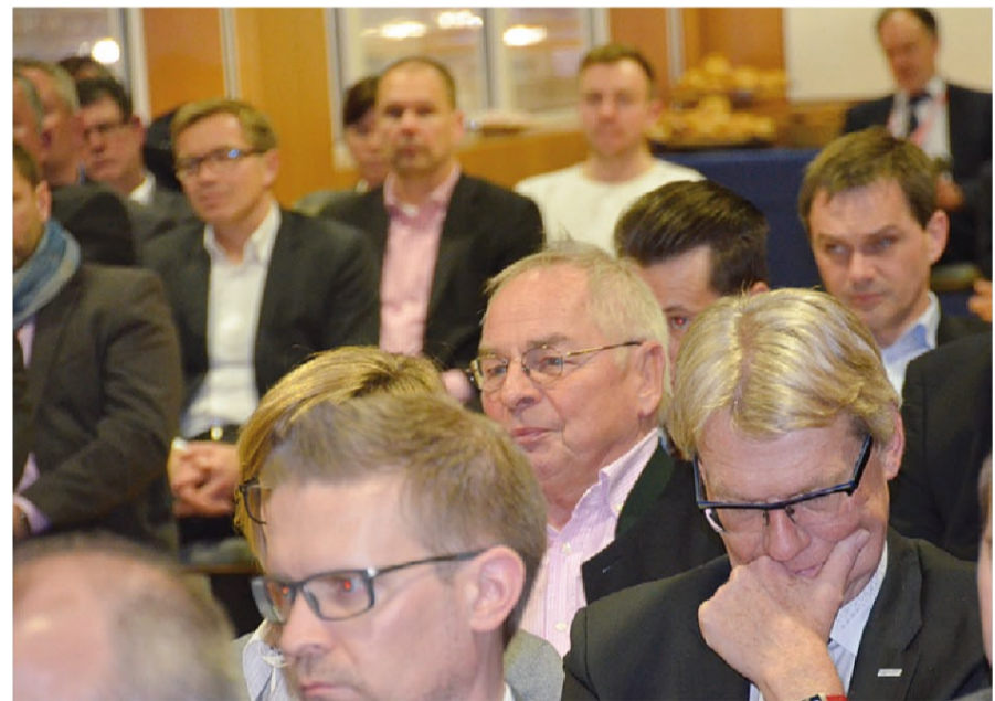
Hersteller, Groß- und Einzelhändler sowie Vertreter der Handelskooperationen zählten zu den Zuhörern

im Sortimentsaufbau. Dann sehen wir die Notwendigkeit für Eigenmarken. Und als Drittes folgen dann die No-Name- oder Importprodukte.