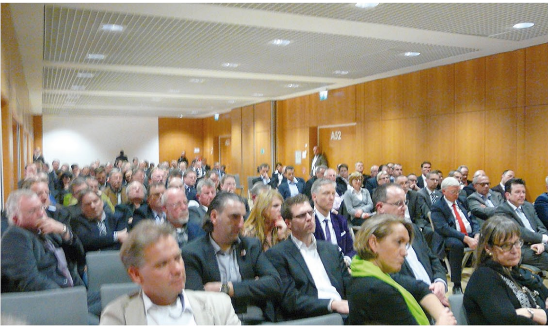
Allem Anschein nach wurde auch in diesem Jahr das „richtige“ Thema gewählt

wort ebenfalls ganz klar: Die Menschen suchen Orientierung. Wenn ein Produkt außer einer guten Qualität nichts mehr zu bieten habe, dann wäre man hier auf der Messe schnell ganz schön