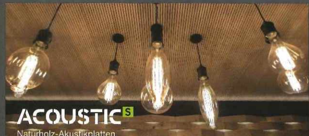
ACOUSTIC S Naturholz-Akustikplatten

A WIE ADMONTER ODER ALLES AUS EINER HAND