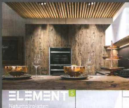
ELEMENT S Naturholzplatten