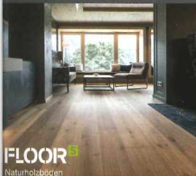
FLOOR S Naturholzböden

Klöpferholz ist dem Einkaufsverbund Holz, EVH, beigetreten und damit 11. Gesellschafter der Holzhandelsallianz unter dem Dach der Hagebau-Gruppe. Der →